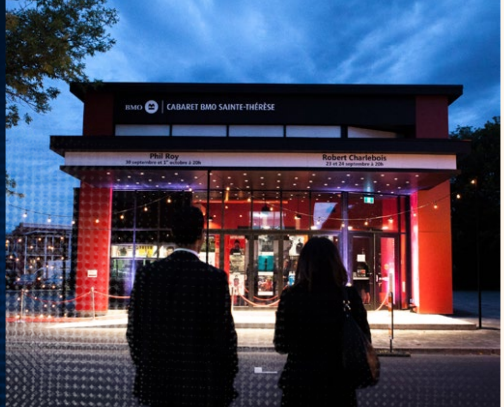
Sainte-Thérèse, Cabaret BMO Sainte-Thérèse